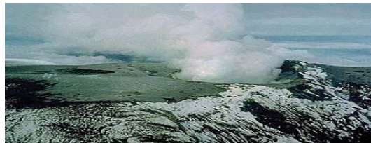
Cima del Nevado del Ruiz a finales de noviembre de 1985

La Cruz Roja de Ibagué contactó a las autoridades de Armero y ordenó una evacuación que no fue llevada a cabo debido a problemas eléctricos causados por una tormenta. La fuerte lluvia y los rayos producto de la tormenta pudieron haber ocultado el ruido del volcán, y sin ningún esfuerzo sistemático de alerta, los residentes de Armero estaban inconscientes de la actividad que se desarrollaba en el Nevado del Ruiz. A las 9:45 de la noche, después de que el volcán hiciera erupción, los oficiales de la Defensa Civil de Ibagué y Murillo trataron de advertir a las autoridades de Armero, pero no pudieron hacer contacto. Después lograron escuchar conversaciones entre algunos dirigentes de Armero y otros individuos; en la más famosa de estas conversaciones, se escucha al Alcalde de Armero hablando a través de una radio casera, diciendo que él “no cree que allí haya mucho peligro”, cuando fue arrastrado por el lahar.