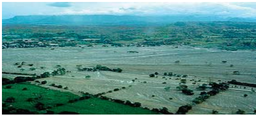
Armero se localizaba en el centro de esta fotografía, tomada a finales de noviembre de 1985.

Un segundo lahar, que descendió por el valle del río Chinchiná, mató a cerca de 1.800 personas y destruyó 400 casas en Chinchiná. En total murieron más de 23.000 personas, cerca de 5.000 quedaron heridas y 5.000 hogares de trece poblaciones fueron destruidos. Aproximadamente 230.000 personas se vieron afectadas, 20.000 quedaron sin hogar y 110 kilómetros cuadrados de terrenos fueron perjudicados.