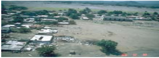
Armero tras la tragedia.

truendo proveniente de la montaña, pero los residentes estaban más preocupados por lo que ellos creían era solo una inundación.